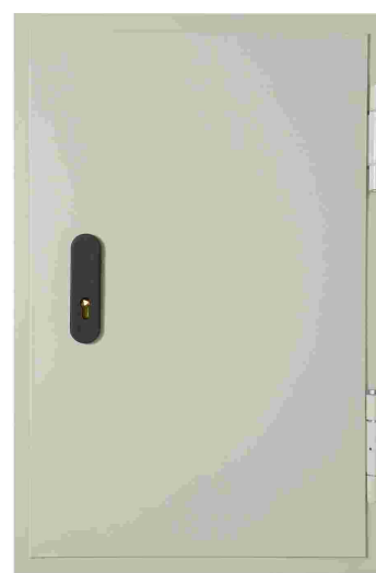
Medidas de hueco de obra